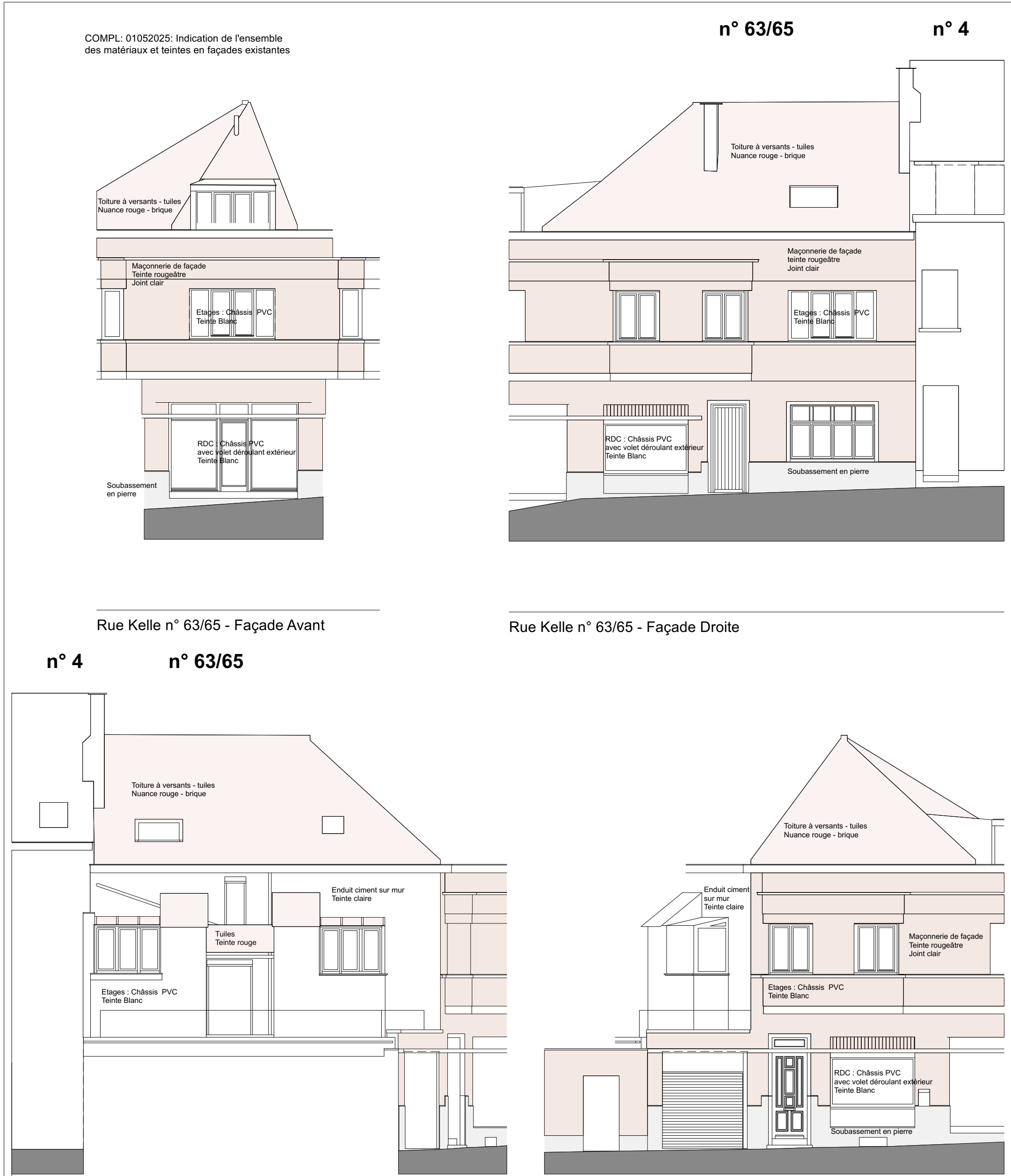
ELEVATION ARRIERE - RUE KELLE